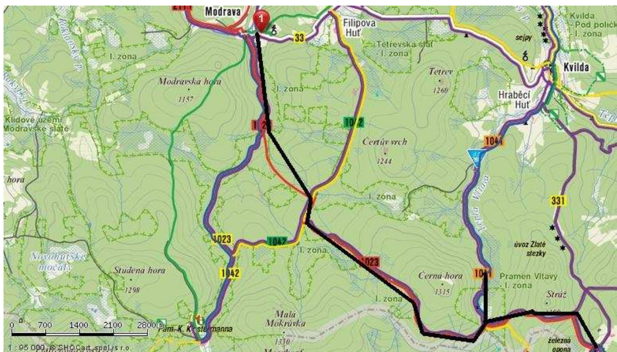
Z Modravy přes Černou horu a pramen Vltavy do Bučiny...