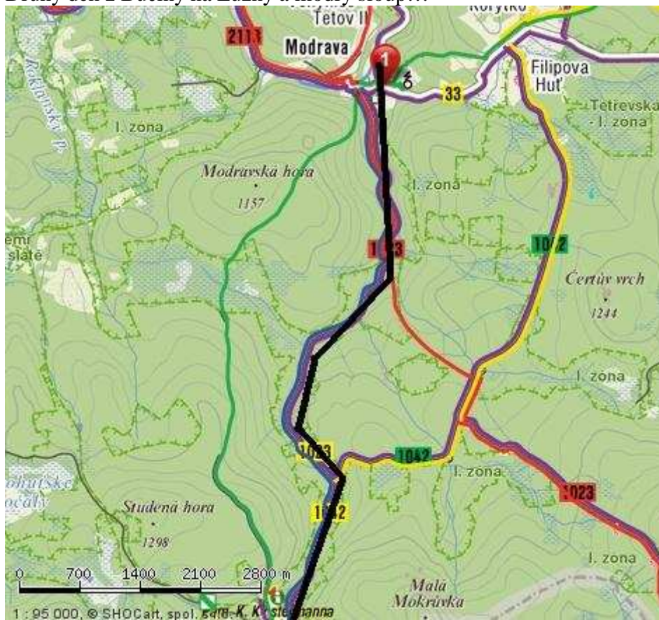
A zpět do Modravy a dále busem do Srní...